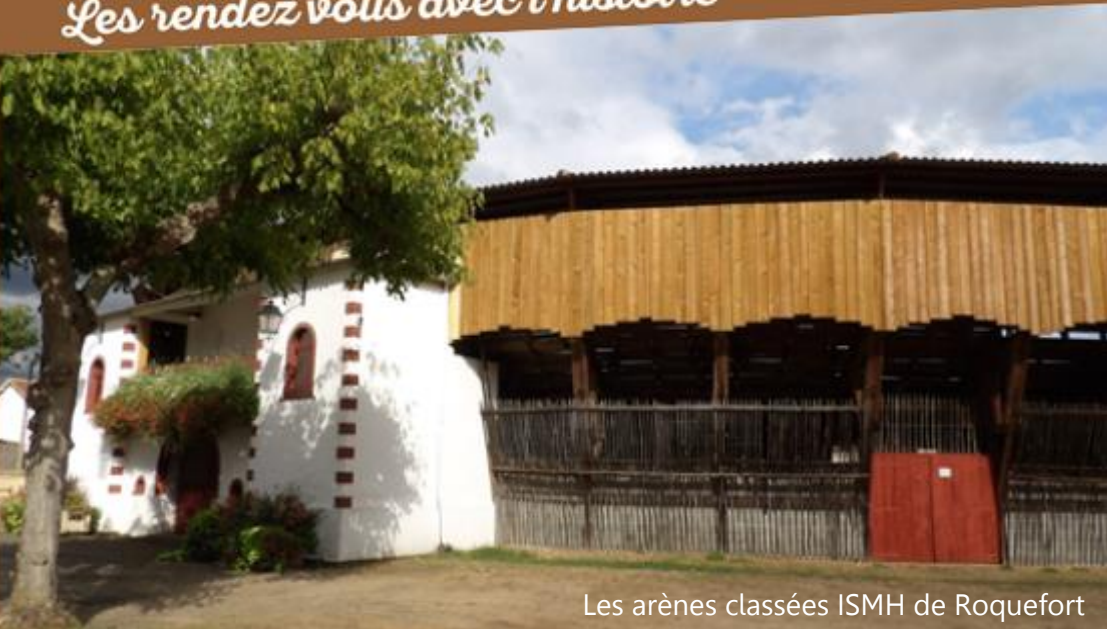
Les arènes classées ISMH de Roquefort