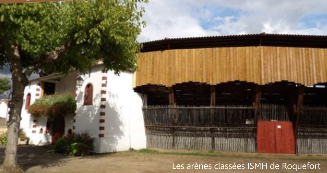
Les arènes classées ISMH de Roquefort