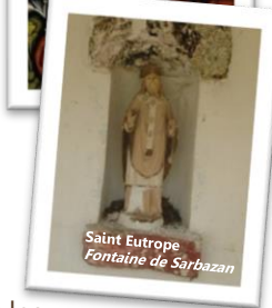
Saint Eutrope Fontaine de Sarbazan