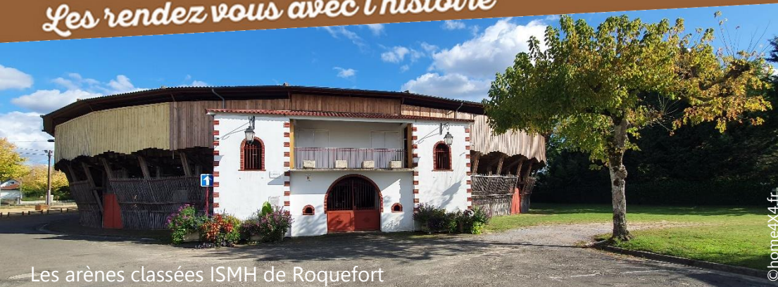
Les arènes classées ISMH de Roquefort