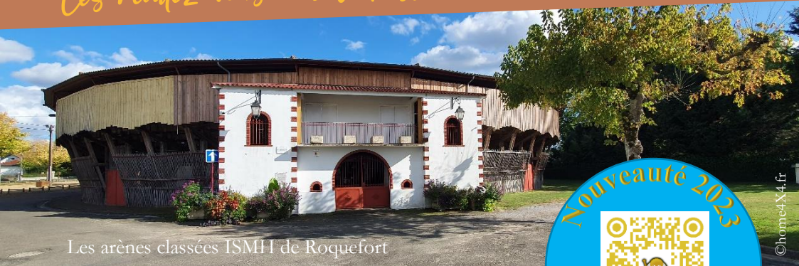
Les arènes classées ISMH de Roquefort